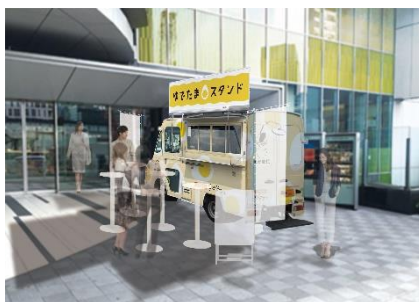
東京会場（渋谷ヒカリエ）イメージ

アクセス： 京王井の頭線「渋谷駅」と2階連絡通路で直結 東京メトロ銀座線「渋谷駅」と1階で直結 東急線・地下鉄線「渋谷駅」B5出口直結