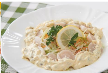
ほたてのサラダ仕立て (いんげんとピクルスのマヨ仕立て使用)