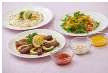
シェフおすすめレシピ 3 選

『Qummy 便り』 デリサラダソース https://qummy.kewpie.co.jp/journal/178