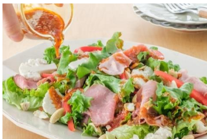
ローストビーフとカリフラワーのデリサラダ (パプリカとごま使用)