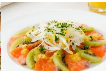
サーモンとキウイフルーツのデリサラダ (たまねぎとにんじん使用)