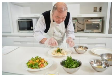
ソースを開発したシェフの試作風景

サイト内のよみもの『Qummy 便り』からは、開発のこだわりや、家でも手軽にシェフの味が楽しめるレシピなどを発信していきます。また、さまざまなアレンジメニューも紹介します。サイト内で販売しているパッケージサラダや豆・素材、トッピングなどにデリサラダソースを組み合わせたサラダセットの販売も展開していきます。