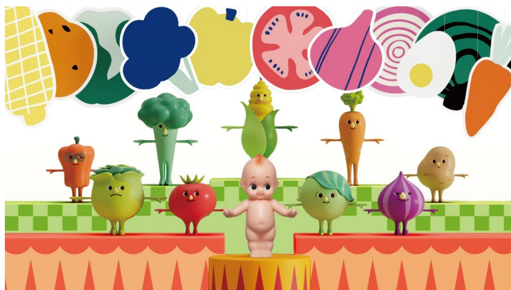
新オープニング・エンディング(イメージ画像)

さらに2023年1月4日(水)から番組のオープニング・エンディングを刷新します。「おもちゃの兵隊のマーチ」をBGMに、バブリーダンスで話題となった振付師akaneさんの振り付けによる新たなダンスを、キューピーとヤサイな仲間たちが踊ります。