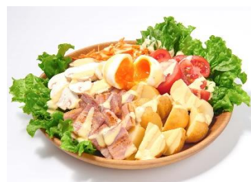
紹介メニュー例：フランスのペイザンヌサラダ