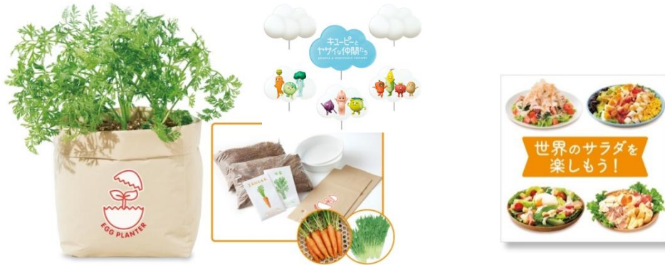
賞品イメージ ㊤収穫体験キット一式(画像はイメージです)、㊦レシピブック(デザインは実際と異なります)

キャンペーンWEBサイト https://www.kewpie.co.jp/dressing/dressing_cp/