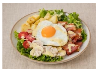
じゃがいもとベーコンのペイザンヌサラダ

キューピーが提案する、基本のペイザンヌサラダです。大きめにカットしたベーコンやじゃがいもが食べ応え抜群です。中央にのせた目玉焼きやゆで卵が目を引きまます。