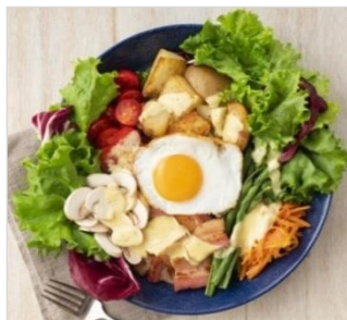
ペイザンヌサラダ

新型コロナウイルス感染症拡大以降、サラダや野菜の食卓出現頻度が増加しています。キューピーが提案するペイザンヌサラダは、野菜と卵を必ず使うのが特徴です。野菜に良質なタンパク源の“卵”を合わせると、より理想的な栄養バランスとなることから、コロナ下の健康ニーズに応えるサラダと言えます。