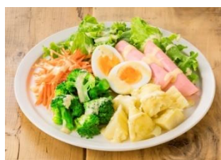
ゆで卵とじゃがいものペイザンヌサラダ