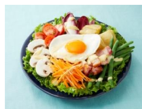
彩り野菜のペイザンヌサラダ