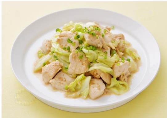
キャベツと鶏むね肉のドレッシング炒め

※1 「キューピー 深煎りごまドレッシング」と「キューピー すりおろしオニオンドレッシング」