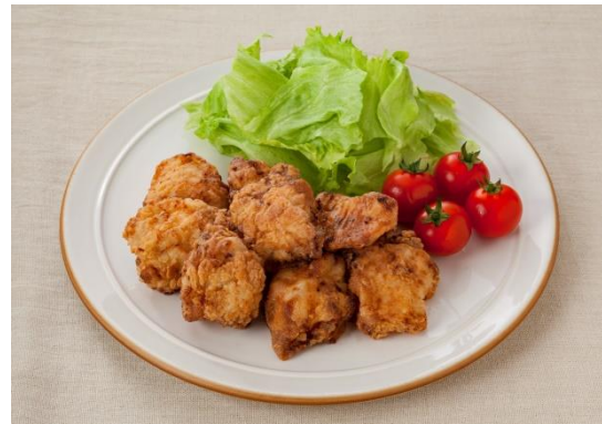
すりおろしオニオンドレッシングで！から揚げ

ドレッシングの機能を生かしたこれまでの調理研究によって、ドレッシングに漬け込むことで鶏むね肉がやわらかく、おいしくなることが分かっています ※2 。キューピー公式サイト（特設サイト「ドレテク」） ※3 では、この調理法を使ったレシピを多数、公開しています。今回、この調理法に関して、キューピー公式サイト内でアンケート調査を実施しました。