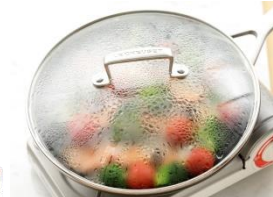
野菜とソースを加え、ふたをし、中火で 4分、弱火で4分蒸し焼きにします。 ※ソースはね注意。