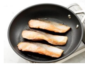
皮目が焼けたら、裏返します。