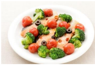
鮭とブロッコリーの蒸し焼き (ガーリックソース使用)