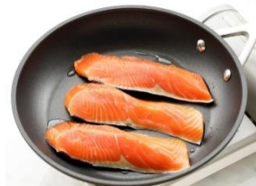
フライパンにサラダ油を入れて中火で 熱し、生鮭を皮目から中火で約2分 焼きます。