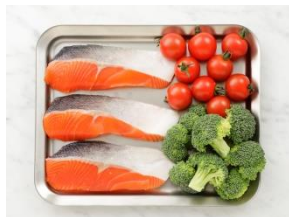
生鮭切り身 2~3切れ(200~300g)、 野菜の分量は 200gが目安です。