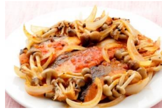
鮭とぶなしめじの蒸し焼き (トマトのソース使用)