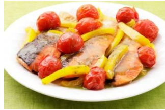
鮭とミニトマトの蒸し焼き (バジルソース使用)