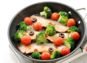
完成！ ※加熱時間は調理の具合を見て 加減してください。