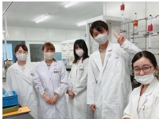
東京農業大学「エッグイノベーション」の研究員

今後は、冷凍・解凍しても安定する泡の開発に寄与する、一つの要素技術として活用していく。