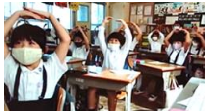
「マヨネーズ教室」 (オンラインで開催した様子)