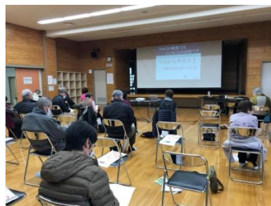
「食をテーマにした講演会」 (オンラインで開催した様子)

https://www.kewpie.com/education/lecture/