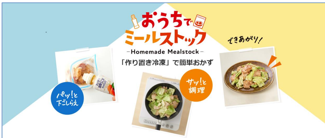
「おうちでミールストック」サイト イメージ