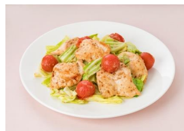
深煎りごまドレッシングで！ 鶏むね肉とキャバツとミニトマトのソテー

週末にまとめ買いされることの多い鶏むね肉や豚ロース肉と、ドレッシングを使った作り置き冷凍レシピを掲載します。解凍後の調理時間が10分～15分の簡単レシピをまとめました。