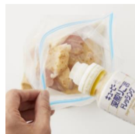
“作り置き冷凍”の下ごしらえ

新生活が始まる4月に向け、週末の作り置きで平日の“時産”につながる“作り置き冷凍”のレシピを新たに開発し、特設サイト「おうちでミールストック」で3月31日(水)から公開します。サイトでは、ドレッシングで下味を付けた肉と、家にある野菜を炒めるだけでメインディッシュが出来上がる簡単なレシピを紹介しています。