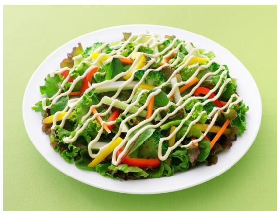
パプリカとブロッコリーのグリーンサラダ

※本品の摂取により疾病が治癒したり、多量摂取によってより健康が増進するものではありません。