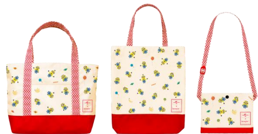
「ミニオン バッグセット」(デザインはイメージ)

「ミニオン エプロンセット」は、オリジナルデザインの大人用・子供用エプロンを3種セットでお届けします(①大人用エプロン(サロンタイプ)②大人用エプロン③子供用エプロン)。いずれも、いろいろな表情が楽しくてかわいいミニオンたちと、キューピーのロゴや赤い網目をデザインした本キャンペーンのオリジナル賞品です。抽選でそれぞれ2,500名様、総計5,000名様にプレゼントします。