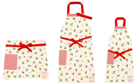
「ミニオン エプロンセット」(デザインはイメージ)

イースターは「復活祭」ともいわれ、キリスト教ではイエス・キリストの復活を祝う大切な祝日です。ヨーロッパなどでは春を祝う祭りとしている国もあります。年によって日付が変わるのが特徴で、2021年は4月4日(日)と5月2日(日)がイースターに当たります。