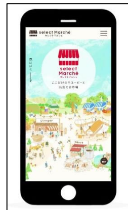
セレクトマルシェ TOP ページのイメージ(㊟パソコン ㊟スマートフォン)