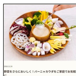
⑤ソースマルシェ TOP ページのイメージ ④⑥特集記事=「モノがたり」のイメージ

2021年夏以降、新たなマルシェの追加や、キューピーとお客さま、またお客さま同士が交流できるコミュニティの開設を予定しています。