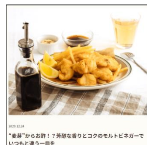
⑤ビネガーマルシェ TOP ページのイメージ ④⑥特集記事=「モノがたり」のイメージ

【ソースマルシェ】 https://www.kewpie.co.jp/selectmarche/sauce/