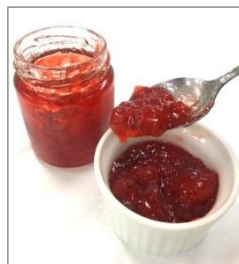
「夢つづき2号」を 使用したジャム

「良い製品は、良い原料から」と考えるアヲハタは、より良い原料の調達のためフルーツの栽培から取り組んでいます。そのような原料への強いこだわりがあるからこそ、今後もアヲハタと農研機構は、イチゴの新品種育成の取り組みを継続し、イチゴのさらなる持続的な生産と安定した供給の実現を目指します。