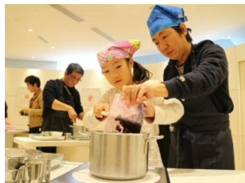
「ジャムデッキ」での ジャム作り体験の様子

またアヲハタの体験型施設「アヲハタ ジャムデッキ」で「夢つづき2号」をジャム作り体験に活用するなど、原料や産地に関する取り組みを発信していきます。