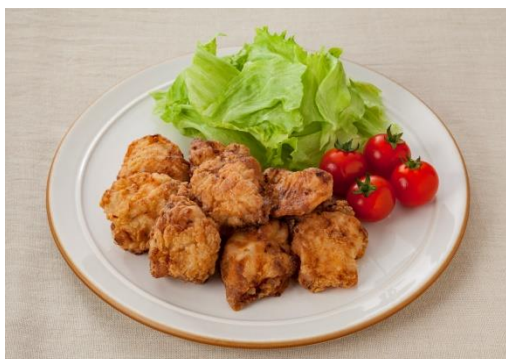
すりおろしオニオンドレッシングで！ から揚げ