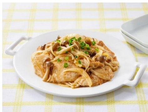
すりおろしオニオンドレッシングで！ 鶏むね肉ときのこのソテー