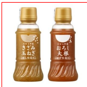
のせる野菜「きざみ玉ねぎ」「おろし大根」 9月16日(水)から全国販売

※ サラダクラブニュースリリース No.18 参照 https://www.saladclub.jp/company/press/