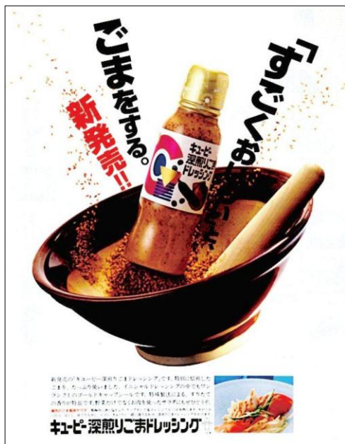
2000年発売当時の雑誌広告「すごくおいしい」と、ごまをする。

2000年： 深煎りごまドレッシング 200ml 発売 シーザーサラダドレッシングと併せ、「金キャップ」シリーズで発売