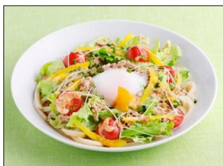
ツナと半熟たまごの 深煎りごまサラダうどん

※2 特設サイト URL : https://www.kewpie.co.jp/fukagoma/