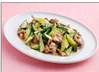
豚肉ときゅうりの 深ごま炒め

併せて、7月下旬からは、TVCMを放映します。“広がる自由。”のコピーとともに、サラダうどんを中心として、炒め物や肉料理を提案し、これ一本で味が決まり、アイデア次第でメニューが広がっていくことを紹介します。