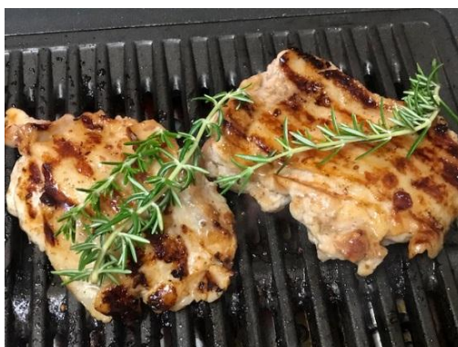
Marinated Chicken with KEWPIE DEEP ROASTED SESAME DRESSING