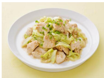
キャベツと鶏むね肉のドレッシング炒め

※2「ドレテク」サイト： https://www.kewpie.co.jp/dressing/dretech/