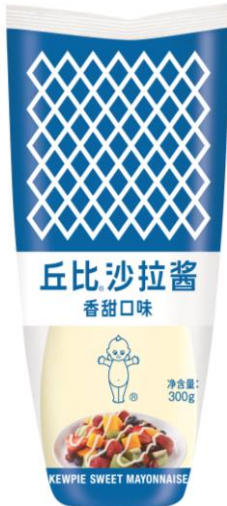
中国で販売されている、甘いタイプのマヨネーズ