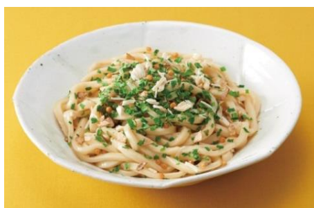
(パッケージ裏面のアレンジレシピ) 香ばしバター醤油のうどん