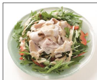
豚しゃぶと水菜のサラダ

酸化に弱いアマニ油を製品中に27%と高含量配合することで、20gで \alpha -リノレン酸を2.6g摂取できるようにした機能性表示食品です。“血圧が高めの方に”と表示します。