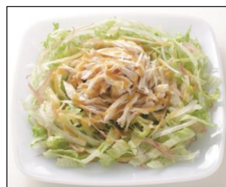
レタスとみょうがと鶏ささみのサラダ

20gで難消化性デキストリンを5g摂取できる機能性表示食品です。“脂肪や糖分の吸収を抑える”と表示します。