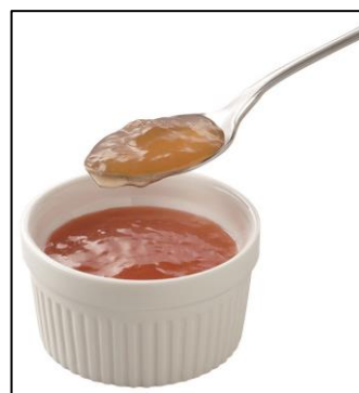
ジュレ状にすることで野菜によく絡む「レモンとアセロラドレッシング」

また、「アマニ油入りごまドレッシング」に使用するアマニ油は、大豆油や菜種油と比べて酸化しやすく、通常はドレッシングに多用することが難しいとされています。製造工程での酸化を極力抑えることで、商品中27%と通常より高い割合の配合を実現しました。