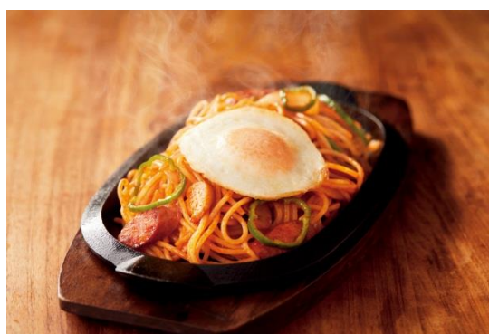
昔ながらのナポリタン

キューピーは、中食・外食が“より満足に”“より身近に”なるために、変化する市場に対応した商品価値と機能をお届けします。