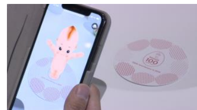
飛び出すARキューピー (写真はイメージ)