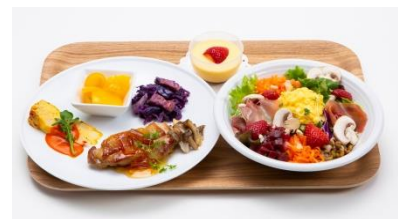
スペシャルランチプレート

店内には、卵と野菜をテーマにした装飾を施しました。卵をモチーフにしたフォトスポットを設置するほか、AR技術を使って、飛び出すキューピーと一緒にメニューや店内撮影が楽しめます ※2 。その他、100周年の記念グッズやキューピーオリジナルグッズなども販売します。