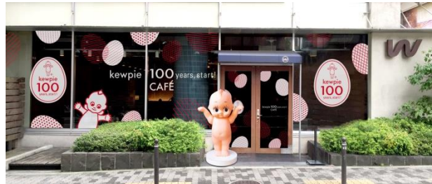
店舗外観(写真はイメージ)

「kewpie 100 years, start! CAFÉ」は、「サラダとタマゴのおどろき、たのしさ、未来へ!」がコンセプトです。キューピーグループがこれまでに育ててきた、サラダとタマゴの魅力が体験できるオリジナルメニューを提供します。