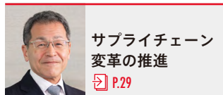
サプライチェーン 変革の推進 P.29