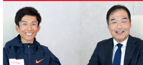
トップメッセージ 特別対談 P.5 P.26

トップの「想い」と、志を共にするパートナーとの対話を通じて、当社グループが大切にしている変革の意志をお伝えします。