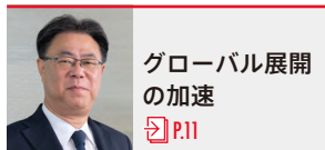
グローバル展開 の加速 P.11

現場が直面する課題を受け止め、成長への「次の一手」をいかに繰り出すか。着実に変革を前へ進めるリーダーたちの具体的なアクションと意志をお伝えします。