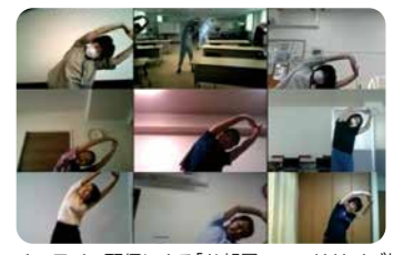
オンライン配信による「お部屋でエクササイズ」

運動不足解消のため、自宅でもできるトレーニング動画の配信や、室内運動イベントを開催しています。また、工場や事業所では、毎日ラジオ体操を実施しています。