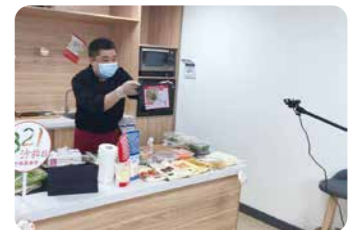
北京丘比食品の従業員によるオンライン商談

お客様への直接の訪問が難しい状況となる中、お客様とオンラインでつなぐ商談を開始しました。実際に商品を使用する様子などを映像でお届けして説明できるため、使用イメージが分かりやすいとご評価いただいています。