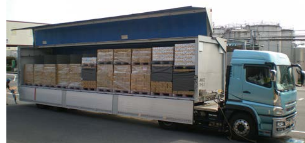
共通トレーラー輸送による実車率向上

さらに、2019年7月からは、サンスター株式会社、日本パレットレンタル株式会社と、トラックと船舶を組み合わせた3社共同輸送(関西・九州間)を開始しました。マヨネーズやドレッシングなどの重量品とハミガキやハブラシなどの軽量品を組み合わせて輸送することにより、コンテナ空間を有効活用し、より多くの荷物の輸送に成功しています。